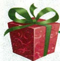
素敵なプレゼント