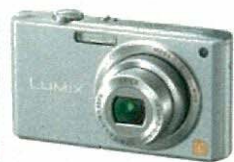
デジタルカメラ 抽選で2台