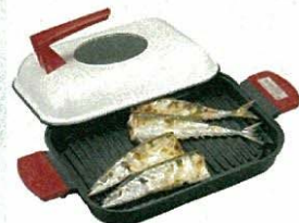
スチームロースター 抽選で1台