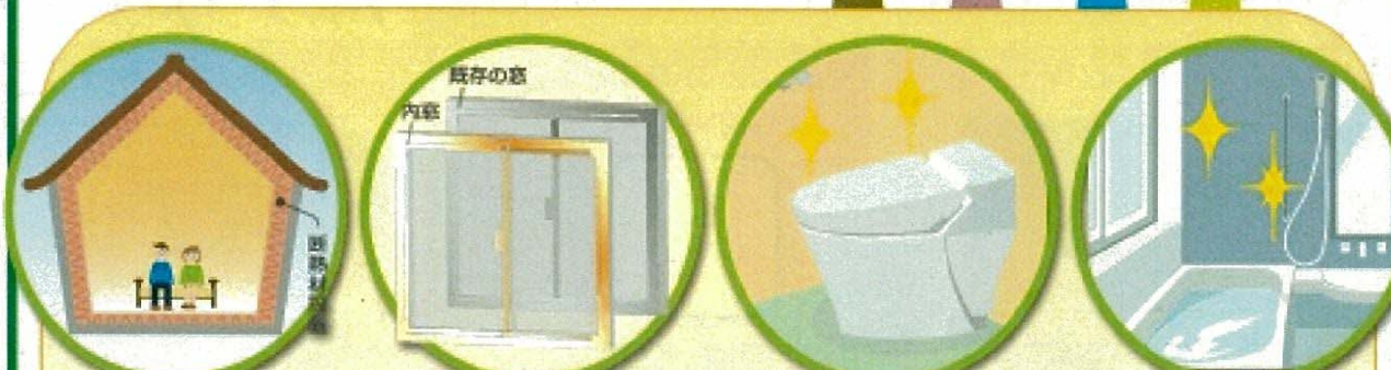
ア.断熱改修(内・外壁等) イ.断熱改修(窓) ウ.節水トイレへの改修 エ.高断熱浴槽への改修