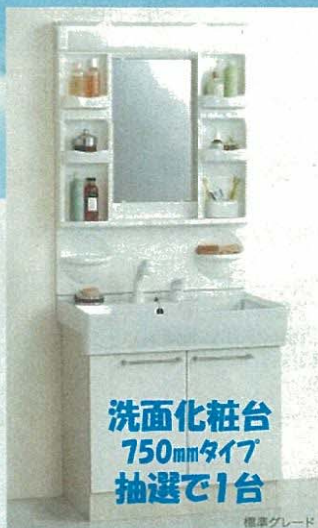
洗面化粧台 750mmタイプ 抽選で1台